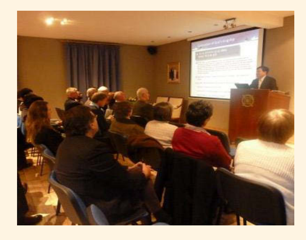
(6) Switzerland Seminar