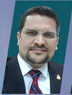
HON. DAVID REYES

Gerente General del Congreso Nacional de Honduras, Parlamentaria (2014-2022)