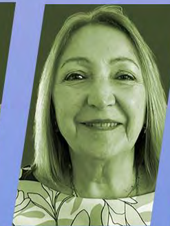
HON. SILVIA DEL ROSARIO GIACOPPO

Presidenta del Parlamento Latinoamericano y Caribeño (PARLATINO); Senadora Nacional, Argentina.