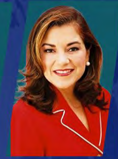
HON. LORETA SANCHEZ

Diputado Congreso de la República del Perú (2016-2021)