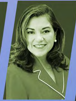
HON. LORETA SANCHEZ

Diputado Congreso de la República del Perú (2016-2021)