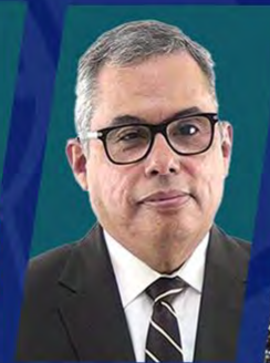
DR. JULIO RAUDALES

Cámara de Representantes de Estados Unidos (1997-2017)