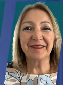
HON. SILVIA DEL ROSARIO GIACOPPO

Presidenta del Parlamento Latinoamericano y Caribeño (PARLATINO); Senadora Nacional, Argentina.