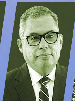
DR. JULIO RAUDALES

Cámara de Representantes de Estados Unidos (1997-2017)