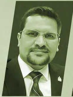
HON. DAVID REYES

Gerente General del Congreso Nacional de Honduras. Parlamentario (2014-2022)