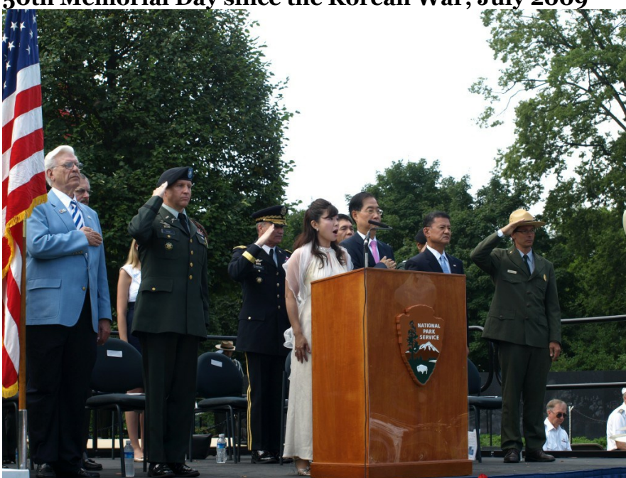
With Korean Ambassador to the US

Performance of the American National Anthem at the 50th Memorial Day since the Korean War, July 2009