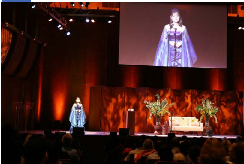
Performing at the first International Day of Yoga event at Lincoln Center (June 21 st )