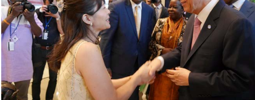
Talking about peace with Secretary-General Ban Ki-moon at the United Nations