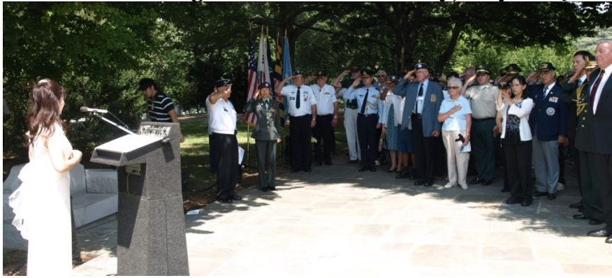
At Korean War Memorial with American Armed Forces couple (Korean and American) 2009