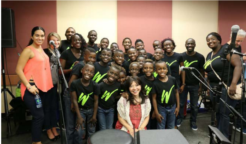
With the Watoto Children's Choir from Uganda (June, 29th)